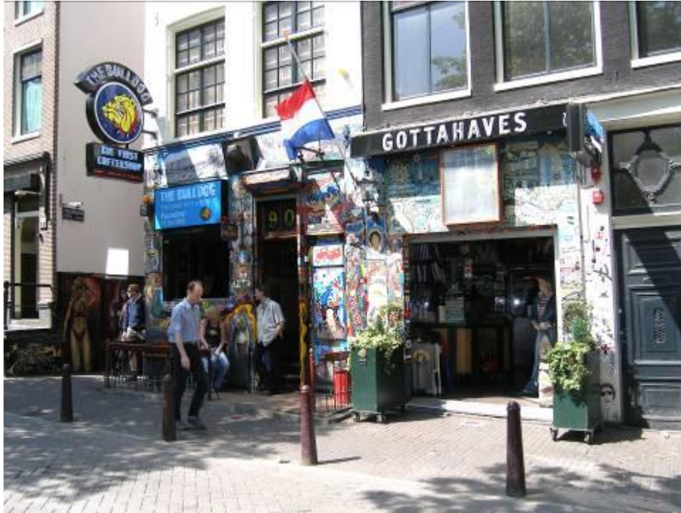
Het Bulletje en de gottahaves