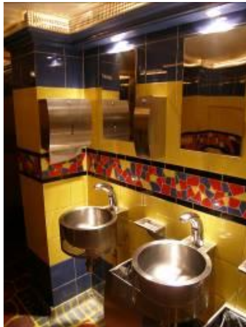
De toiletten in het Palce