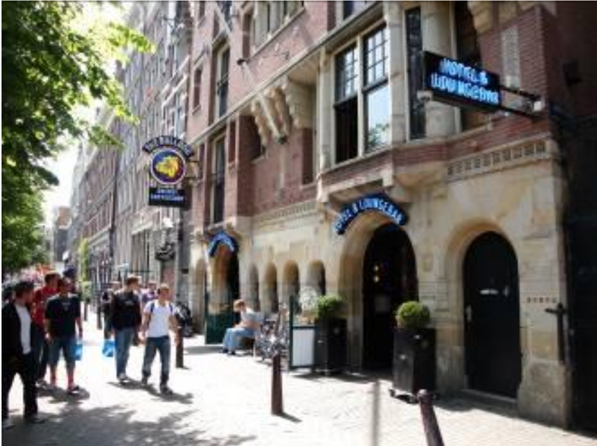
Het Bulldog Hostel