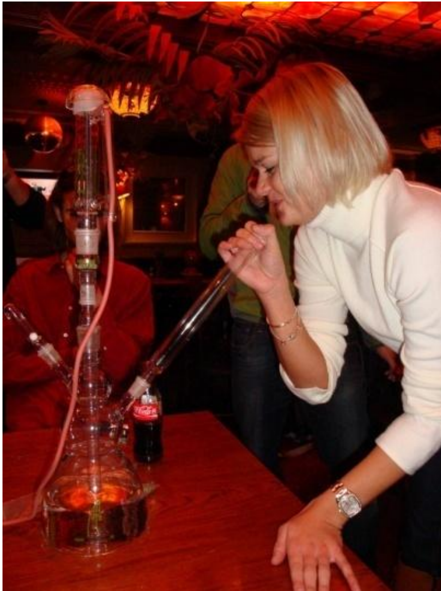
Onbekende (oosteuropese?) touriste, stooft als eerste op de Verdamer af nam enkele flinke hijsen, "hmmmm, yes I like this!" En weg was ze weer.