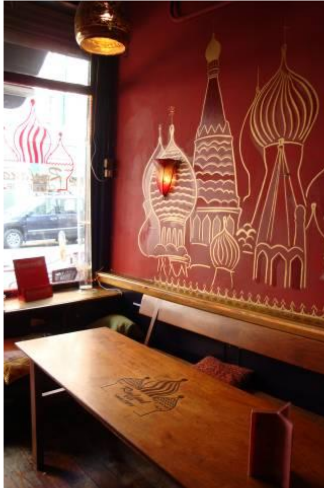
Foto 11. Consequent doorgevoerd sfeervol Interieur in het Rusland