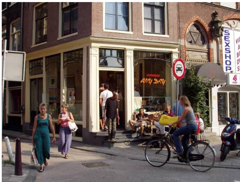
Foto 1. Anyday zit op een hoek aan een drukke Spuistraat

Er staan enige tientallen verdampers (de 'Rolls') klaar voor gebruik. De shop zit op een hoek en heeft aan twee kanten ramen, zodat je uitzicht hebt op een drukke spuistraat en twee stegen. Dat alles gelardeerd met de nodige rood verlichte ramen waarachter dames vriendelijk naar voorbijgangers staan te zwaaien. Ook vermakelijk zijn de mannen die zogenaamd toevallig in de buurt moeten wezen en heen en weer drentelen. Opmerkelijk is dat de klanten van Anyday daar juist weinig oog voor hebben, ze zijn bezig met elkaar te kletsen, of voor zich uit te staren, een joint te draaien of met hun Rolls te klooiën. De muziek is comfortabel op de achtergrond aanwezig zodat de gasten elkaar goed kunnen verstaan en een goed gesprek kunnen voeren. Een goede coffeeshop is er in eerste plaats voor de sociale interactie en pas in de tweede plaats een plek om er hasj of wiet te kopen.